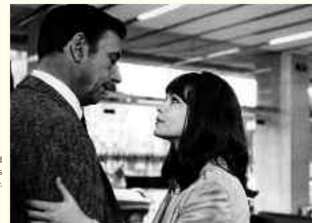
Yves Montand est Diego Mora dans La Guerre est finie.