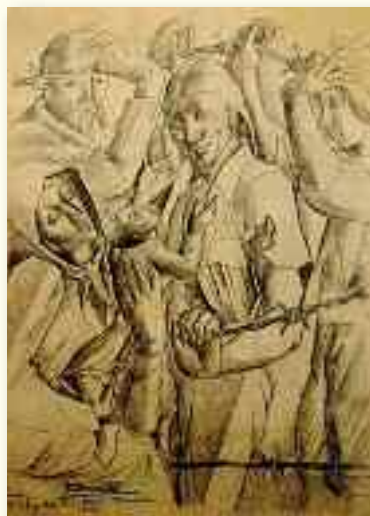
Le camp d'Argelès par Pierre Daura