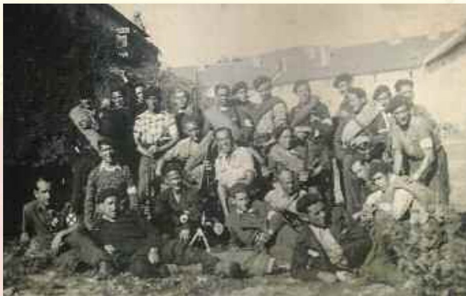
Groupe de guérilleros ayant participé à la bataille de la Madeleine