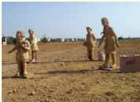
Sculptures de Serge Castillo

◆ Soirée commémorative à partir de 18h avec des chants par le groupe Memoria, deux expositions de sculptures sur terre par Serge Castillo et de ferronneries, une paella et le spectacle « Exils d'Espagne, de la Retirada à aujourd'hui » de Susana Azquinezzer avec Bernard Ariu, accordéoniste.