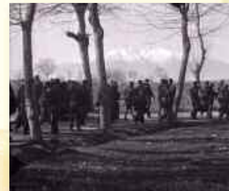
L'exode d'un peuple

Mail : musee-rigaud@mairie-perpignan.com