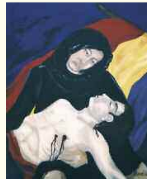
Tableau de Pilar Badie

Entrée libre sauf mention contraire Contact : Mairie de Bagnols-sur-Cèze Tél : 04 66 50 50 55 Mail : culture@bagnolssurceze.fr http://www.bagnolssurceze.fr/