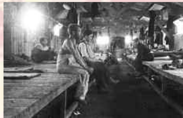
Intérieur d'un baraquement du camp d'Agde.