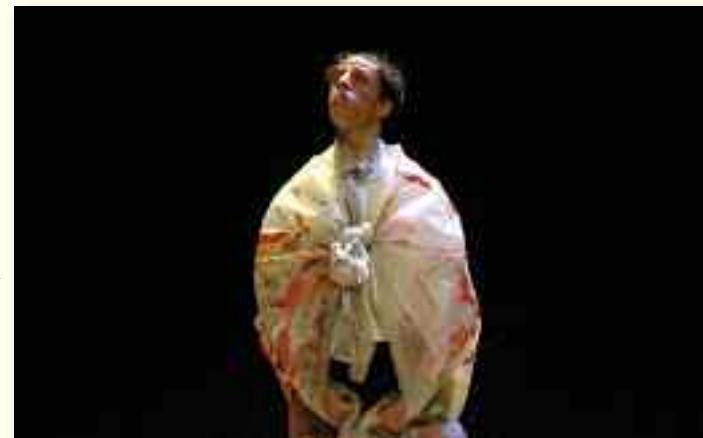
Compagnie Baro d'Evel Cirk