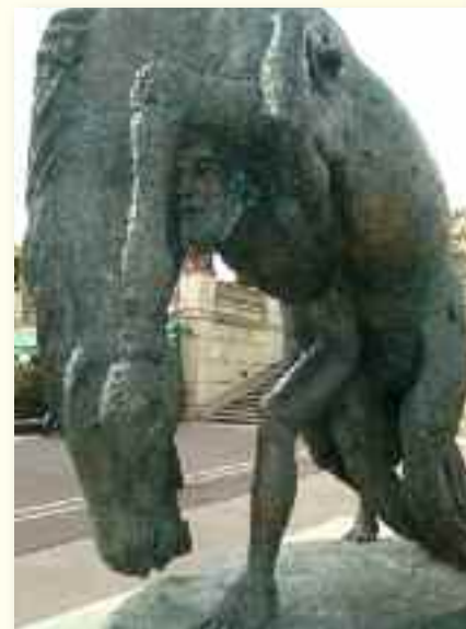
Roland Furieux de A. Fenosa

Contact : Centre Joë Bousquet et son Temps Maison des Mémoires – Maison Joë Bousquet 53 rue de Verdun 11000 Carcassonne Tél : 04 68 72 50 83 Mail : centrejoebousquet@wanadoo.fr