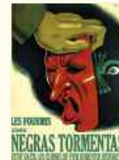
LES FEMMES NEGAS TORMENTAS THEATRE MASQUE